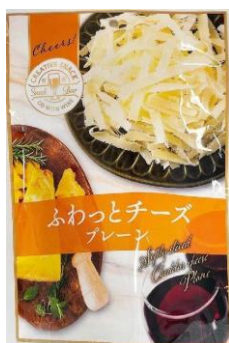
ふわっとチーズ プレーン